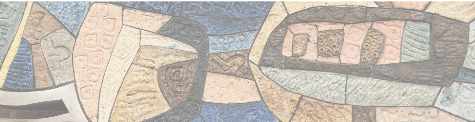
Finn Christensen, utsnitt av verket Den odontologiske tann , 1968, utenfor Det odontologiske fakultet