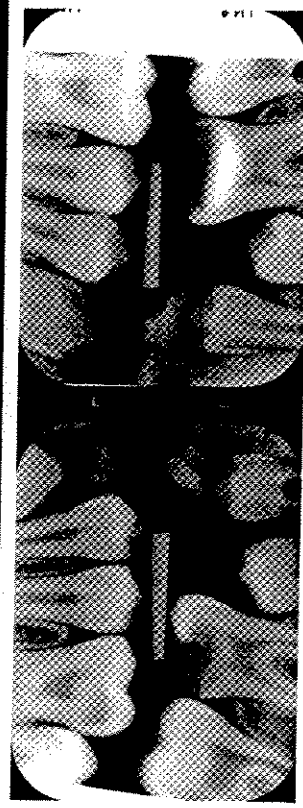
Langsvarsoppgave 10.sem. V2006